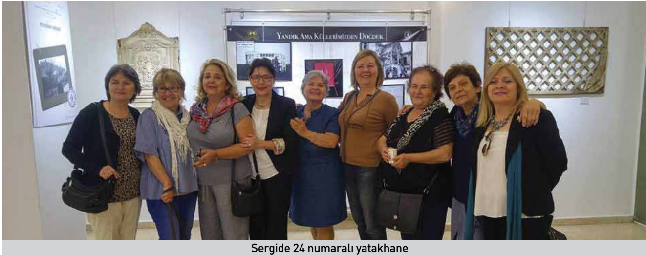
Sergide 24 numaralı yatakhane