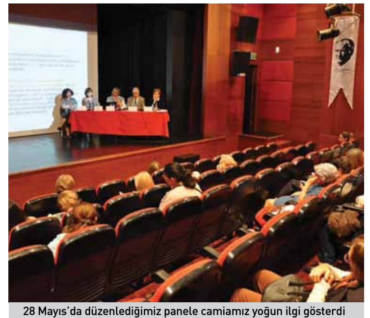
28 Mayıs'da düzenlediğimiz panele camiamız yoğun ilgi gösterdi