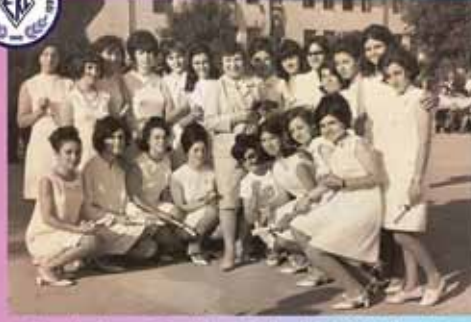
Genç kızların yüz yılını aydınlandığı EKL bahçesinde 2 Temmuz 1967'de yapılan Mezuniyet Töreni...

Geleneksel hale getirmeye çalıştığımız yıllık Gala Yemeğimizde 28 Nisan Cuma saat 19.30'dan itibaren Marmara Yelken Kulübü'nde buluşuyoruz. 100. yıl kitabımızın lansmanı, 50.yıl mezunlarımızın plaket töreni yanı sıra belgesel çalışmalarımızdan gösterimlerinin de yer alacağı yemeğe 150 TL bağış karşılığı katılabilirsiniz. Rezervasyon için ekl@eklder.org.tr adresine e-posta göndererek katılımcı sayınızı bildirmenizi rica ederiz.